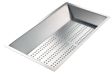
Perforierte Edelstahlwanne 8151 000 * nur in Kombination mit dem Zubehör 8644 101